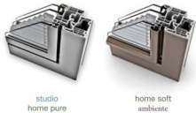
studio home pure home soft ambiente